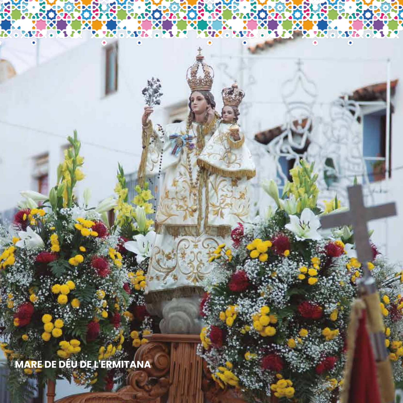
MARE DE DÉU DE L'ERMITANA